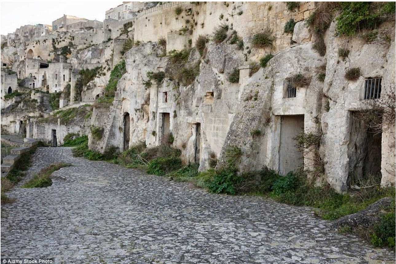
MATERA : I SASSI

I Sassi sono due antichi rioni in parte scavati e in parte costruiti con la tenera pietra sedimentaria tipica della Murgia. Sono un grande esempio di architettura spontanea: si sono sviluppati gradualmente a partire dall' VIII secolo d.C., senza alcuna pianificazione, sulle pendici delle due piccole conche rocciose ai lati del colle della Civita, il primo insediamento urbano della città di Matera realizzato in epoca magno-greca, tra il VI e il V secolo a.C.